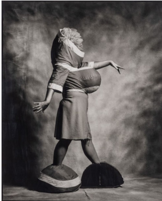
Fergus Greer, ohne Titel (Leigh Bowery im Kostüm) , o.J. © Fergus Greer

Cocktail Prolongé. F.C. Gundlach Special | 5. Juni – 22. September 2026