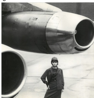
F.C. Gundlach, „Jet Age“, Hamburg 1963