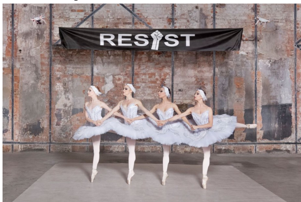
Halil Altindere, Ballerinas and Police , 2017 (Still) Collection FRAC des Pays de la Loire © Halil Altindere

Inner Mornings, Or Forms of Counterculture | 5. Juni – 13. September 2026