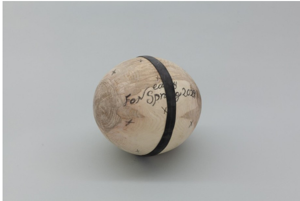
Nina Porter, für den frühen Frühling 2029 , 2025 Holz, Gummi, Metall, Baumwolle, Bleistift, Farbe. Schachtel: Kaliko, Farbe, Band, Schaumstoff, Karton, 21 x 17 x 19 cm

Nina Porter. Sample Question | 5. Juni – 22. September 2026