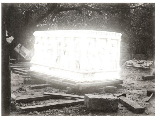
Akram Zaatari, Aus der Serie: An Extraordinary Event , 2018. Inkjet Print, in 8 Teilen, 44,6 x 35,7 x 3,5 cm. Fotos basieren auf dem AbdulHamid-Album #91533.

ABER ICH DIE WELT ICH SEHE DICH* | 5. Juni – 4. Oktober 2026 | (*Rémy Zaugg)