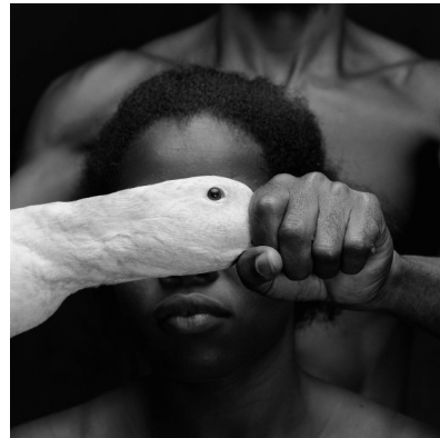
Mario Cravo Neto, Odé , 1989