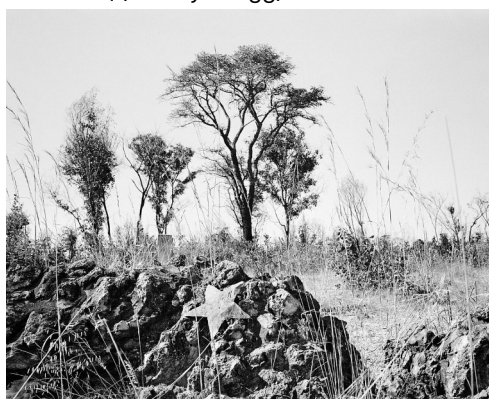
Jo Ractliffe, Unmarked set of graves on the outskirts of Cuito Cuanavale (Aus der Serie: As Terras do Fim do Mundo ), 2009. Individuell bedruckter Platinabzug, 37 x 44,4 cm © Jo Ractliffe

Für druckfähiges Bildmaterial: presse@pr-netzwerk.net