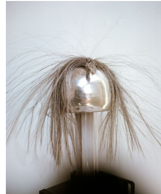
Nina Porter, Sample Question , 2026