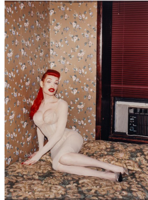
Katharina Bosse, Untitled , 1999 © Katharina Bosse