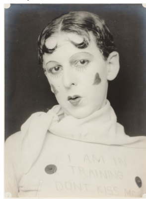
Claude Cahun, Untitled , 1927 Black-and-white photography © Musée d'arts de Nantes. Photo: Cécile Clos